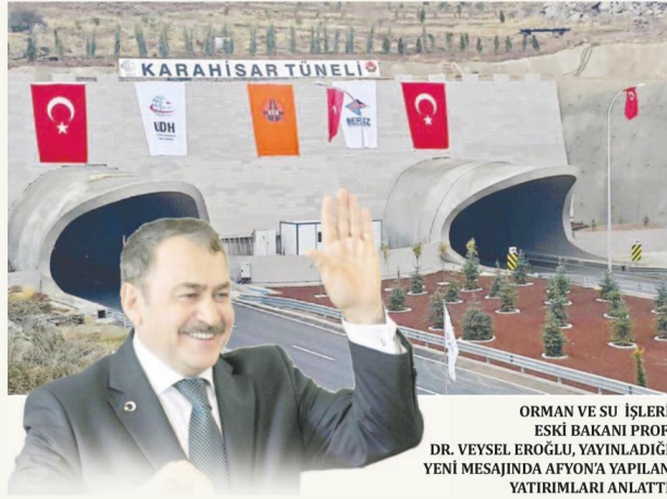
ORMAN VE SU İŞLERİ ESKİ BAKANİ PROF. DR. VEYSEL EROĞLU, YAYINLADIĞI YENİ MESAJINDA AFYON'A YAPILAN YATIRIMLARI ANLATTI

Orman ve Su İşleri eski Bakanı İlimiz Milletvekili Prof. Dr. Veysel Eroğlu yeni yıl mesajı yayınladı AK Parti İktidarında ilimize yapılanları sıraladı. Eroğlu, "2021 yılının ülkemiz ve Afyonkarahisar'ımız için hayırlara ve berekete vesile olmasını rabbimizden niyaz ediyorum"