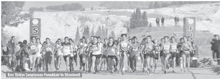
Kros Türkiye Şampiyonası Pamukkale'de Düzenlendi