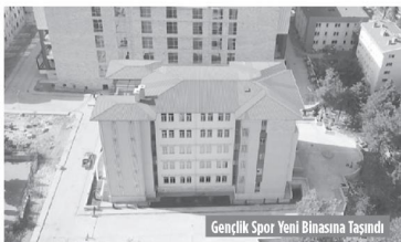
Gençlik Spor Yeni Binasına Taşındı