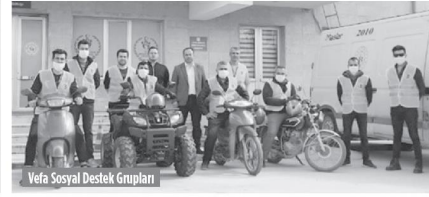
Vefa Sosyal Destek Grupları