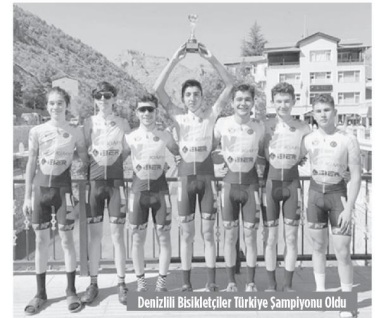
Denizlili Bisikletçiler Türkiye Şampiyonu Oldu