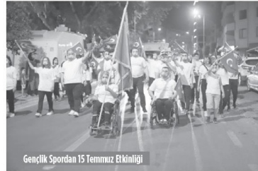
Gençlik Spordan 15 Temmuz Etkinliği

Pamukkale Gençlik Spor İlçe Müdürlüğü 15 çalışanı ve 5 gönüllü genç ile pandemi sürecinde Kaymakamlık emrinde bulunan Vefa Sosyal Destek