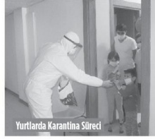
Yurtlarda Karantina Süreci