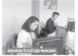
Antrenörler 112 Acil Çağrı Merkezinde