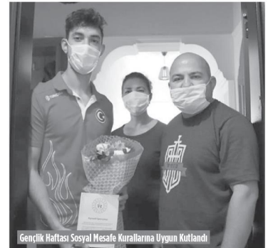
Gençlik Haftası Sosyal Mesafe Kurallarına Uygun Kutlandı

Spor Toto Teşkilat Başkanlığı ile Gençlik ve Spor İl Müdürlüğü arasında gerçekleştirilen reklam sözleşmesi ile Tavas'a kazandırılan ilçe futbol stadi 3.239.203 TL'ye mal oldu. Tesisin Ocak ayında hizmete geçeceği kaydedildi.