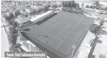
Tavas Yeni Sahasına Kavuştu

İl merkezinde bulunan oda ve yatak kapasitesi fazla üç öğrenci yurdu Prof. Dr. Cevat Akışit Yurt Müdürlüğü, İbni Haldun ve Fatma Yıldız Hanım Yurt Müdürlükleri karantina süreci boyunca ev sahipliği yaptı. Hollanda'dan yurda gelen 342 misafir,