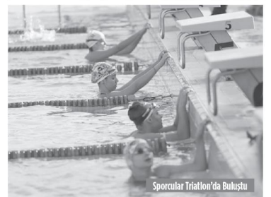
Sporcular Triatlon'da Buluştu