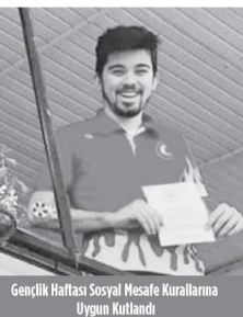
Gençlik Haftası Sosyal Mesafe Kurallarına Uygun Kutlandı

Türkiye Bisiklet Federasyonu tarafından Gümüşhane'de düzenlenen Yıldızlar Türkiye Şampi-