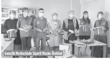
Gençlik Merkezinde Siperli Maske Üretimi