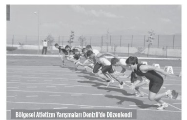
Bölgesel Atletizm Yarışmaları Denizli'de Düzenlendi